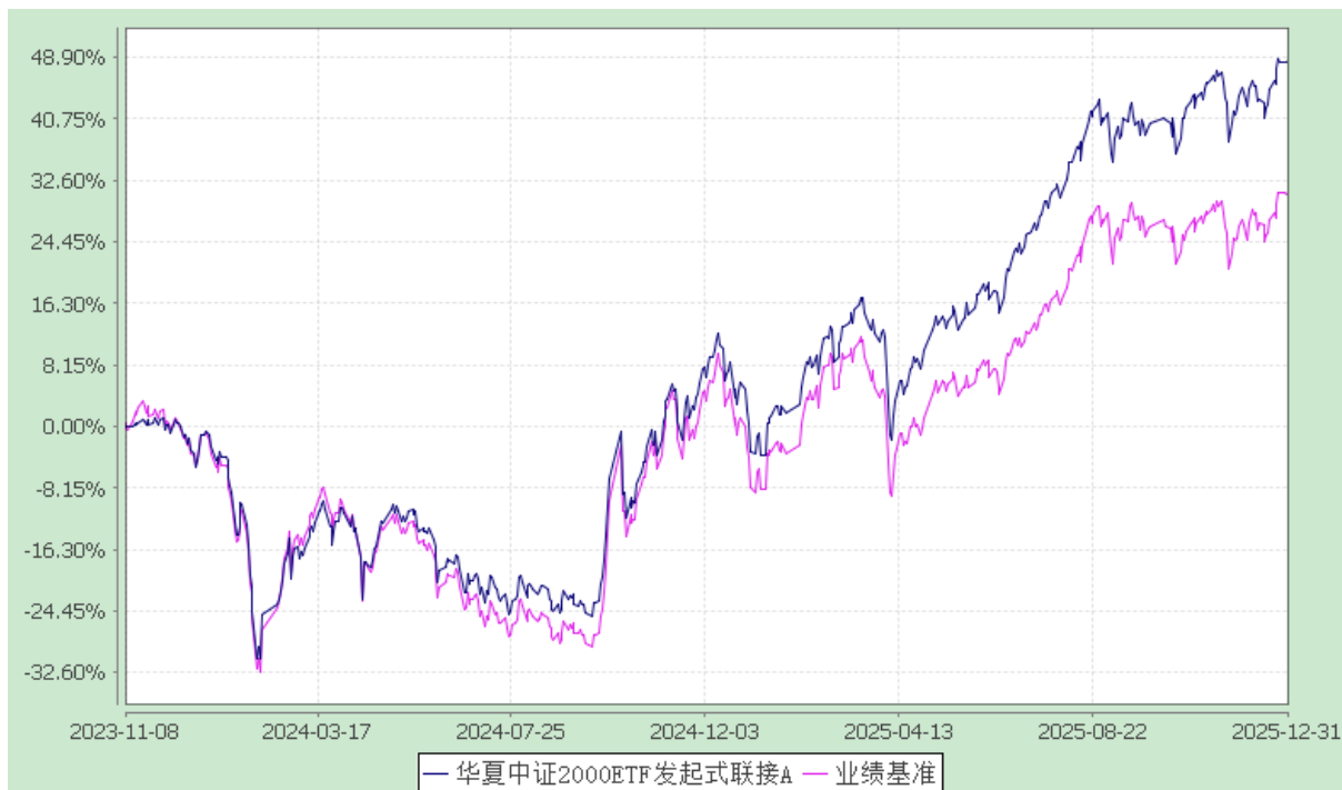
华夏中证 2000ETF 发起式联接 C